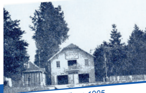
La SNL en 1905